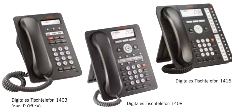
Digitales Tischtelefon 1403 (nur IP Office)

Die Serie 1400 digitaler Tischtelefone kombiniert herkömmliche Telefonfunktionen wie z. B. LED-Anzeigen und fest programmierte Funktionstasten (z. B. Konferenz, Übergabe, Halten) mit Optimierungen im Bereich Benutzerführung wie z. B. Softkeys, einem Navigationsblock und kontextsensitiver Benutzerführung. Standardmäßig verfügen die